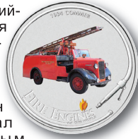
Рис. 5 Английская пожарная машина «Коммер» 1934 года выпуска. Этот автомобиль известен тем, что стал единственным, прибывшим по вызову на тушение пожара к кафедральному собору г. Ковентри после налёта фашистских бомбардировщиков во время Второй мировой войны. Под изображением пожарной машины с надписью «1934 COMMER», обрамлённым стилизованным пожарным шлангом, расположена полукруглая надпись «FIRE ENGINES», рядом с которой расположено цветное изображение языка пламени.

Начиная со второй монеты данной серии («Пож. машина AA-60 (О-ва Кука) – 05») к надписи «FIRE ENGINES» («Пожарные машины») второй строкой мелким шрифтом добавлены слова «OF THE WORLD» («мира»).